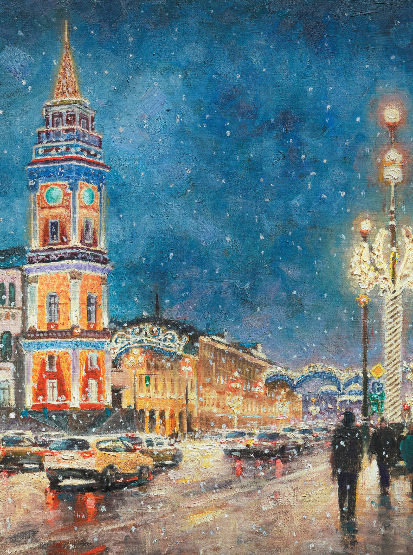
Художник — Разживин Игорь Владимирович @razzhivinigor